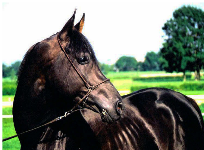
Bild: Ijtiyez, 6-jähriger rein tunesischer Hengst, siegreich in Tunesien von 1'300 bis 2'000 Meter.