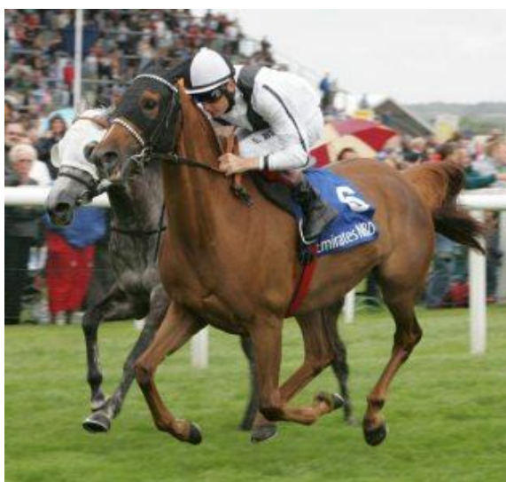
Bild: Quesche du Paon, 2004 (Akbar x Bint El Bedia), zweifache Gruppe 1 Siegerin aus der Familie der Samaria.

Mit dem Sieg im Juli 2009 in den NBD Hatta International Stakes, Newbury, England ist Quesche du Paon eine frische Gruppe 1 Siegerin auf dem internationalen Rennparkett. Die 5-jährige Stute in saudiarabischem Besitz weist aktuell eine Bilanz von 11 Starts, 4 Siegen, 7 Plätzen und einem Preisgeld von € 96'000.- auf ihrem Konto aus. Im Jahr 2008 gewann sie bereits Frankreichs wichtigstes Stutenrennen, den als Gruppe 1 mit € 100'000 ausgeschriebenem Qatar French Arabian Breeders Cup in Saint Cloud - Paris.