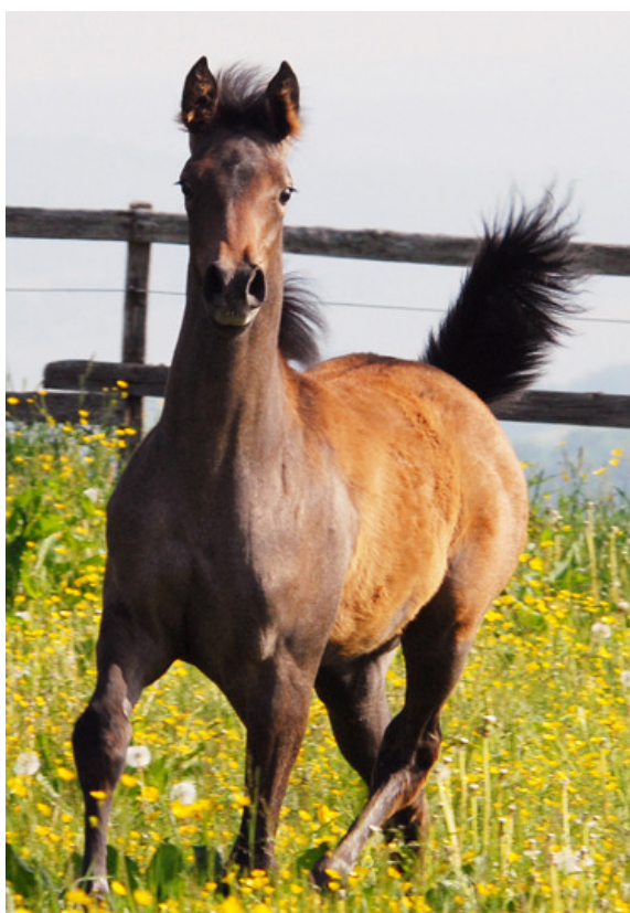
Bild: Nil Kebira, 2009, ebenfalls eine Kahloucha Tochter von Dahess hier im Alter von 10 Wochen. Nil Kebira ist zu 2/3 tunesisch gezogen.

Der Hengst Madjani war eines der erfolgreichsten Rennpferde der letzten Jahre. Er absolvierte insgesamt 17 Rennen von denen er 13 gewann und dreimal als Dritter platziert war. Als bisher einziges Pferd schaffte er es, die in den Vereinigten Arabischen Emiraten wichtigste mit USD 350'000 dotierte Gruppe 1 Prüfung „Dubai Kahayla Classic“ dreimal hintereinander zu gewinnen. Seine Gewinnsumme beläuft sich auf rund € 775'000.-