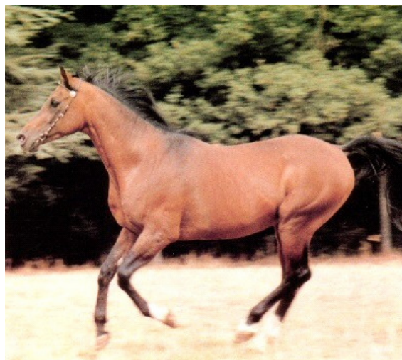
Bild: Baroud III, 1969 (In Chaallah x Barbue), mehrheitlich tunesisch gezogener Hengst mit hohem Einfluss in der französischen Leistungszucht.

Ein früher tunesischer Einfluss erfuhr die französische Vollblutaraberrückzucht. Durch die Kolonialherrschaft der Franzosen in Nordafrika zwischen 1830 und 1962 entwickelte sich ein reger Austausch von Pferden zwischen dem französischen Staatsgestüt Pompadour und den von Frankreich eröffneten nationalen Gestüten in Tunesien, Algerien und Marokko, die unter französischer Aufsicht standen. Zu erwähnen sind Frankreichs Importe aus Tunesien der rein tunesischen Hengste Sumeyr (geb. 1948) von Bango aus der Jamnia und In Chaallah (geb. 1959) von Madani aus der Bango Tochter Gafsa. Der 1969 in Frankreich geborene In Chaallah Sohn Baroud III aus der Sumeyr Tochter Barbue penetrierte die französische Leistungszucht mit seinem tunesischen Blut durch seine über 60 Nachkommen entscheidend.