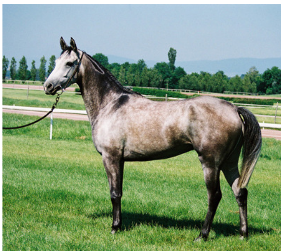
Bild: Zuchtstute Nil Abiat (Darike x Kadjouna de Nerak), mit 30% tunesischem Blutanteil

Eine weitere Vertreterin von Nile Arabians, die 2001 geborene Zuchtstute Nil Abiat (Darike x Kadjouna de Nerak), führt in ihrem Pedigree sowohl über ihren Vater Darike sowie über ihre Mutter Kadjouna de Nerak substantiell tunesisches Blut durch die Hengste Sumeyr, In Chaallah, Besbes, Esmet Ali und zweimal Ourour. Damit erreicht sie einen tunesischen Blutanteil von fast 30%.