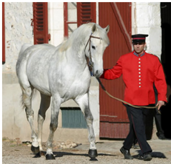
Bild: Dahess, 1999, (Amer x Danie du Cassou), das von der IFAHR am höchsten eingestufte Rennpferd der Welt hat über seine Mutter einen tunesischen Blutanteil von 30%.

Der Amer Sohn Dahess war das im Jahr 2007 von der IFAHR (International Federation of Arabian Horse Racing Authorities) am höchsten eingestufte arabische Rennpferd der Welt. In seiner Rennkarriere ging Dahess 41-mal an den Start, gewann 28 Rennen, davon 13 Gruppe 1 Prüfungen, war 7-mal zweit- und 3-mal drittplatziert. Seine Gewinnsumme beträgt knapp 1 Mio. Euro.