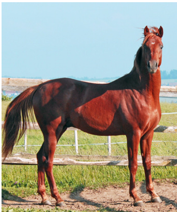
Bild: Nil Karazi, 2007, zweijähriger, franco-tunesischer Hengst im ursprünglichen tunesischen Typ aus der tunesischen Stute Kahloucha und vom französischen Hengst Dormane.

Plätzen und 3 dritten Plätzen aus 19 Starts. Unter anderem gewann er den Grossen Preis von Italien in Grosseto mit einer Dotation von CHF 80'000.--. Seine ersten Nachkommen sind jetzt auf der Rennbahn.