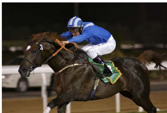
Bild: Madjani, 2000 (Tidjani x Salama), 3-facher Dubai Kahayla Classic Sieger und eines der besten Rennpferde der Welt.

Der Hengst Madjani stammt vom französischen Hengst Tidjani und der rein tunesischen Stute Salama von Sibawaih. Seine Mutter Salama ist eine Vertreterin einer der zurzeit weltweit erfolgreichsten tunesischen Stutenlinien zurückgehend auf die, 1868 geborene Linienbegründerin Samaria. Die desert bred Stute Samaria ist die älteste der sechs Stammstuten des Gestüts Sidi Thabet und wurde aus dem französischen Staatsgestüt nach Tunesien exportiert. In der Abstammung von Salama sind die bedeutendsten tunesischen chefs-de-race wie Sibawaih, Dynamite II, Esmet Ali oder Bango vertreten.