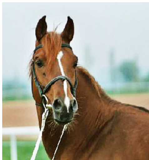
Bild: Itlal, 1996 (Zeidoun x Al Hijara), rein tunesischer Zuchthengst mit einer hohen Eigenleistung.

Plätzen und 3 dritten Plätzen aus 19 Starts. Unter anderem gewann er den Grossen Preis von Italien in Grosseto mit einer Dotation von CHF 80'000.--. Seine ersten Nachkommen sind jetzt auf der Rennbahn.