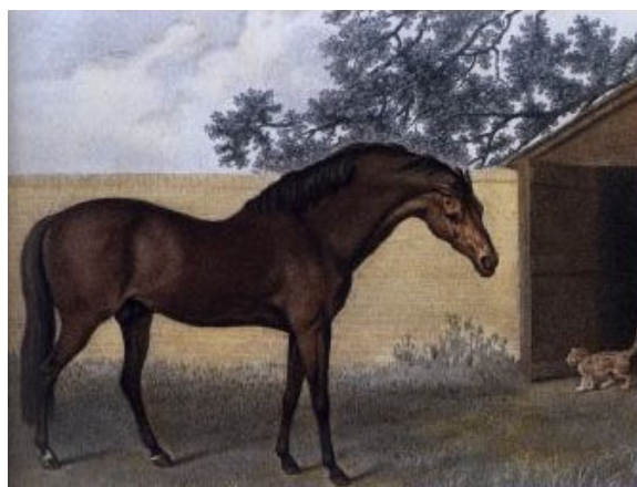
Gemälde von Godolphin.

Der wohl berühmteste tunesische Orientale ist ein nicht Geringerer als der Hengst Godolphin, neben Byerley Turk und Darley Arabian einer der drei Stammväter des Englischen Vollbluts.