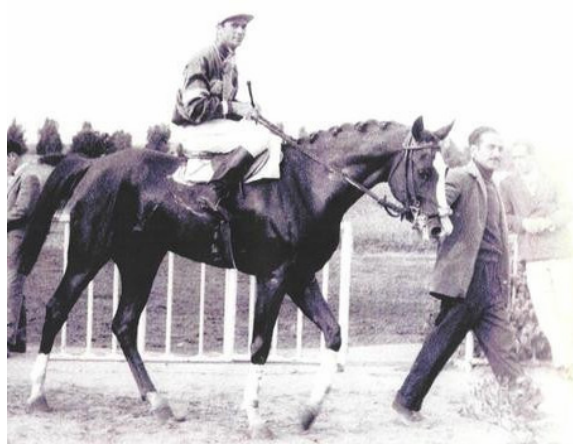
Bild: Esmet Ali, 1955 (Hazil x Arabelle) auf der Rennbahn in Tunesien

In dieser für die tunesische Vollblutaraberzucht kritischen Phase wurde im Jahr 1950 von der tunesischen Regentschaft eine Verfügung erlassen, die den Import von Vollblutarabern regelte und unter ein staatliches Monopol stellte. Ab diesem Zeitpunkt war die Zucht mit den „abendländischen Vollblutaraberhengsten“ nicht mehr zugelassen und es wurden eine begrenzte Anzahl Hengste rein orientalischen Ursprungs aufgelistet und zur Zucht freigegeben. Auf dieser Liste standen Hengste wie Souci, Elias, Loubieh, Kefil, Oramino, Titan, Oukrif, Cheikh El Ourbane, Ibn und Beyrouth. Sie waren die Begründer der heute bedeutenden tunesischen Blutlinien mit ihren daraus entstandenen namhaften Vererbern Koraich, Koufi, Raoui, Soufian, Sibawaih und Esmet Ali. Darunter erlangte der Hengst Esmet Ali aus der Familie der Samaria in der tunesischen Zucht eine herausragende Bedeutung.