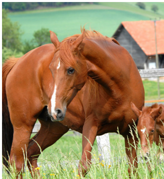
Bild: Kahloucha (Zeidoun x Zannouche), rein tunesische Stute aus der Familie der Samaria

Ebenfalls Teil des Zuchtprogramms von Nile Arabians ist die 1998 geborene original tunesische Stute Kahloucha (Zeidoun x Zannouche), die mit ihren Fohlen unserer Zucht wohl die bedeutendsten tunesischen Impulse verschafft.