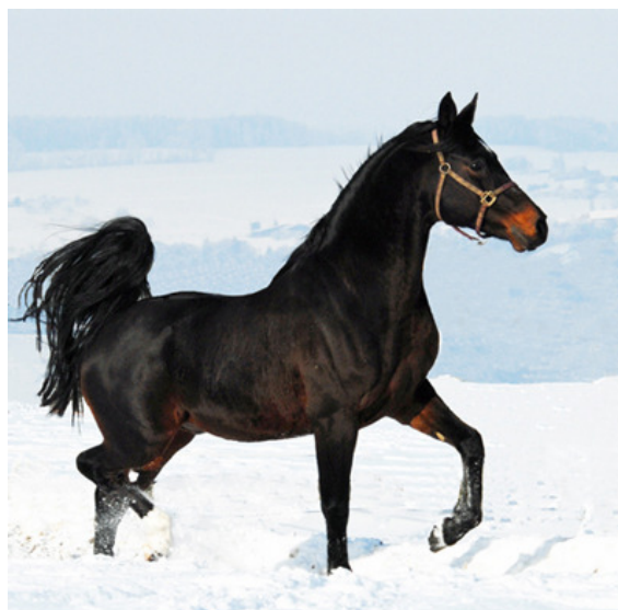
Bild: Zuchthengst Nil Bedouin, 1999 (Barour de Cardonne x Nil Tahani), väterlicherseits auf tunesische Linien zurückgehend

Der 1999 geborene Hengst Nil Bedouin (Barour de Cardonne x Nil Tahani) war unser erstes Zuchtergebnis mit partieller tunesischer Blutführung. Der heute in der Zucht eingesetzte Hengst absolvierte eine erfolgreiche Rennkarriere mit 4 Siegen, 5 zweiten Plätzen und einem 3. Platz aus 16 Rennen mit Gruppe 2 und 3 Platzierungen.