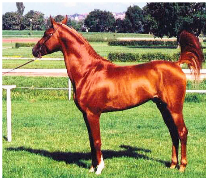
Bild: Khattab, 6-jähriger rein tunesischer Hengst, Rennsieger in Tunesien.

Zusammengefasst ein ausdrucksstarkes, menschenbezogenes und hartes Leistungspferd mit einer guten Grundkonstitution im trockenen und schnörkellosen Wüstentyp.