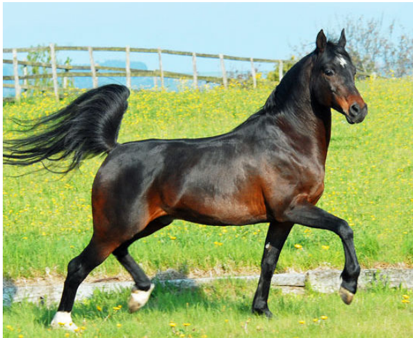
NIL BEDOUIN , 1999 (Barour de Cardonne x Nil Tahani). Eine genetisch seltene und wertvolle Kombination mit 50% französischem, 25% russischem und 25% ägyptischem Blutanteil.

2012 kam ein weiteres NIL BEDOUIN Fohlen von guter Qualität aus unserer Zucht zur Welt. NIL ALAMOON (Nil Bedouin x Nil Anablue) ist ein Stutfohlen aus der gleichen Mutterlinie wie NIL ASHAL und führt mütterlicherseits in der dritten Generation das Blut der Ausnahmestute UNCHANEDD MELODY . Diese Stute ist das erfolgreichste Rennpferd in der arabischen Zuchtgeschichte. Von 38 Starts gewann sie 37 Mal und hält bis heute zahlreiche Bahnrekorde in Amerika und den Vereinigten Arabischen Emiraten.