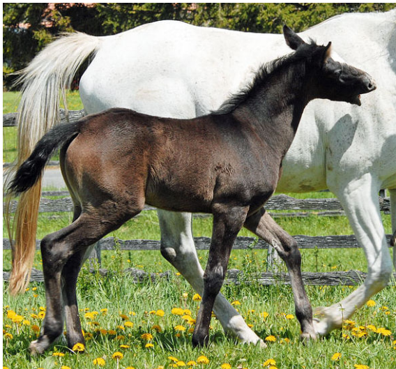
NIL AZIZ , 2012 (Dahess x Nil Abiat) im Alter von 3 Monaten. Das Hengstfohlen ist ein Halbbruder zu Champion Rennhengst NIL ASHAL von NIL BEDOUIN.

Züchterisch interessant werten wir unser 2012 geborenes Dahess Hengstfohlen NIL AZIZ aus der NIL ABIAT (Darike x Kadjouna de Nerak). Die französische Stutenlinie der NIL ABIAT brachte in Qatar mit dem Amer Blut als Outcross einige der besten Rennpferde der letzten Jahre. NIL AZIZ ist ein Halbbruder des 4-jährigen NIL ASHAL (Nil Bedouin x Nil Abiat), Sieger der Jahreswertung Rennen in der Schweiz in diesem Jahr.