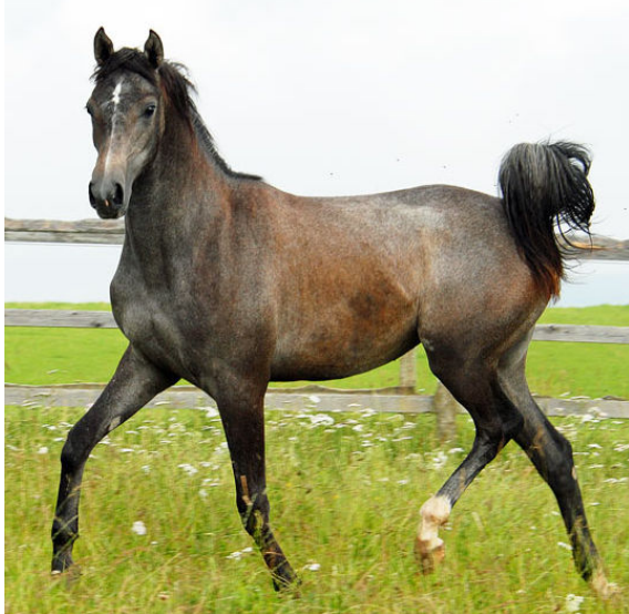
NIL IFFRA , 2011 (Dahess x Nil Incipit), Jährlingstute mit einem interessanten Rennpedigree aus der N-Linie. Ihre

Weitere Dahess Nachkommen aus unserem Zuchtprogramm sind die 1- bzw. 3-jährigen Jungstuten NIL IFFRA , 2011 aus der Elitestute NIL INCIPI , NIL KEBIRA , 2009 und NIL KAMLA , 2011 beide aus der Elitestute KAHLOUCHA . Wir hoffen, dass diese Jungpferde in den nächsten Jahren ihr Potential im Rennsport unter Beweis stellen werden.