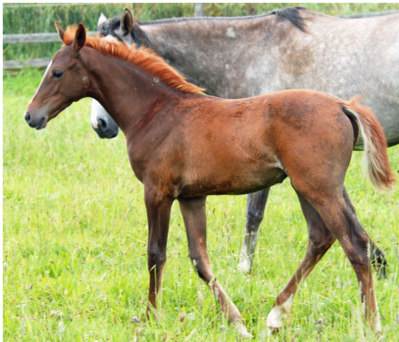
NIL ALAMOON , 2012 (Nil Bedouin x Nil Anablue) ist 3-fach französisch auf ST. LAURENT ingezogen. Als Outcross fließt in ihrer dritten Generation das amerikanische Blut der UNCHAINEDD MELODY und das russische von VERSAL.

2012 kam ein weiteres NIL BEDOUIN Fohlen von guter Qualität aus unserer Zucht zur Welt. NIL ALAMOON (Nil Bedouin x Nil Anablue) ist ein Stutfohlen aus der gleichen Mutterlinie wie NIL ASHAL und führt mütterlicherseits in der dritten Generation das Blut der Ausnahmestute UNCHANEDD MELODY . Diese Stute ist das erfolgreichste Rennpferd in der arabischen Zuchtgeschichte. Von 38 Starts gewann sie 37 Mal und hält bis heute zahlreiche Bahnrekorde in Amerika und den Vereinigten Arabischen Emiraten.