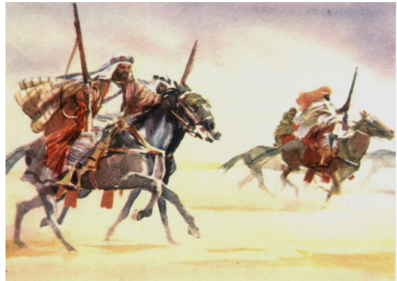
Beduinen auf Beutezug. Schnelligkeit, Härte und Ausdauer entschieden über Leben oder Tod.

In den letzten 100 Jahren hätten arabische Zuchtpopulationen wie die ägyptische, polnische, russische oder französische ohne eine konstante und konsequente Leistungsselektion auf der Rennbahn wohl kaum ihre heutige Bedeutung erlangt.