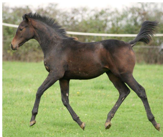
MISS SPIRIT , 2012 (Spirit One x Miss Lloyds), Englisch Vollblutstutfohlen mit einer interessanten Abstammung, in der sich Sprinter- und Steherblut die Waage halten.

Im Sommer 2012 erwarben wir das Englisch Vollblutstutfohlen MISS SPIRIT (Spirit One x Miss Lloyds) im Alter von 3 Monaten. Von seinem Vater SPIRIT ONE liefen dieses Jahr in Frankreich die ersten Zweijährigen auf der