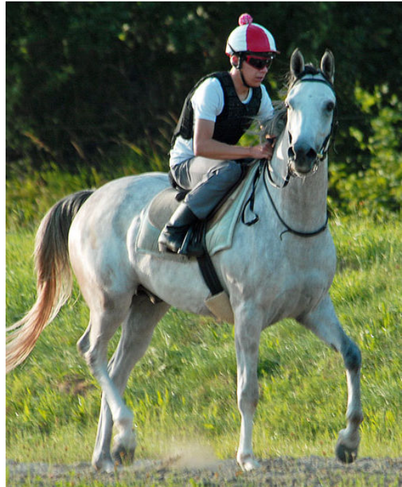
NIL ASHAL , 2008 (Nil Bedouin x Nil Abiat). Champion Rennpferd der Schweiz 2012 nach SZAP Jahreswertung. Der 4-jährige, 1.62 grosse NIL BEDOUIN Sohn ist immer noch in der Entwicklung und konnte daher nur dosiert eingesetzt werden.

Der imposante und harmonische Schimmelhengst kam als Zweijähriger ins Training, bedurfte aber aufgrund seiner Spätreife eines behutsamen Trainings mit einem dosierten Renneinsatz. Auch als 4-jähriger legte er in seiner Entwicklung nochmals zu und erreicht mittlerweile ein Stockmass von 1.62.