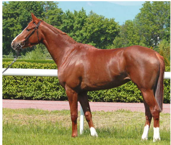
KAHRMA , 2005 (Dormane x Kahloucha), hier als 3-jährige Stute im Renntraining. Nach ihrer Rennkarriere wechselte sie erfolgreich in die Endurance.

Die 7-jährige Dormane Tochter KAHRMA aus der Elitestute KAHLOUCHA absolvierte in der Endurance Saison 2012 in Italien ihre beiden ersten CEN* Prüfungen über 90 Kilometer, die sie auf dem 8. und 10. Rang mit guten Konditionswerten beendete.