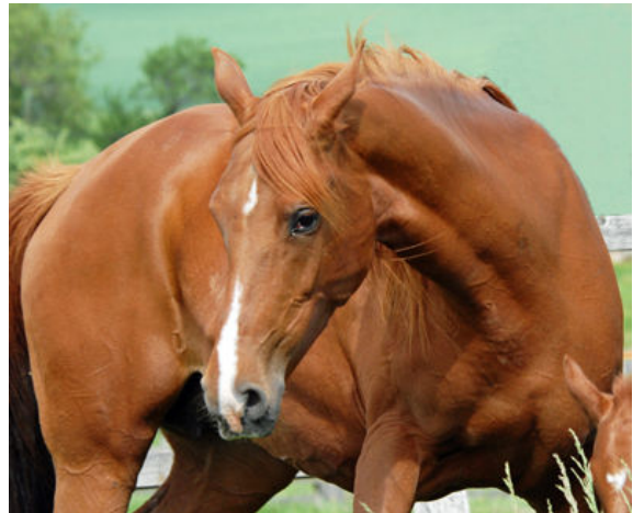
SZAP Elite Stute KAHLOUCHA , 1998 (Zeidoun x Zannouche), siegreichste Rennstute der Schweiz mit Black Type Status und erfolgreicher Nachzucht.

2012 trennten wir uns von einer unserer Stammstuten, der tunesischen Elitestute KAHLOUCHA (Zeidoun x Zannouche). Die 14-jährige KAHLOUCHA war mit 5 Siegen die siegreichste Rennstute der Schweiz und brachte uns vier Nachkommen, darunter NIL KARAZI , 2007 (Dormane x Kahloucha), selber ein Sieger und 2011 Champion Rennpferd der Schweiz. Ihr neuer Besitzer ist ein Rennpferdezüchter und –besitzer aus Abu Dhabi. KAHLOUCHA bleibt auf unserem Gestüt, damit sie europäischen Spitzenhengsten zugeführt werden kann und die Fohlen in unserem Klima optimal aufwachsen können.