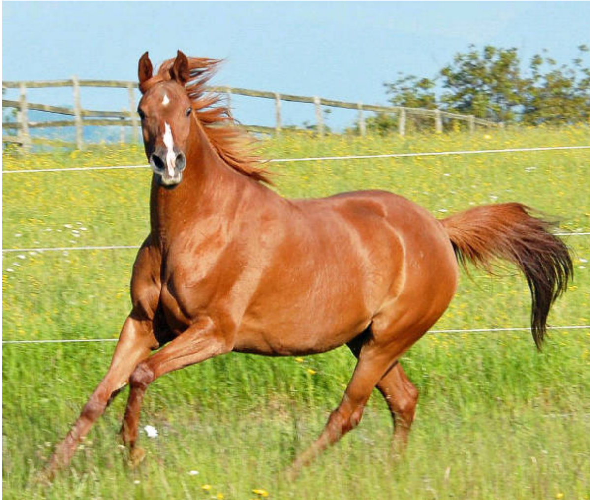
SZAP Elitestute KAHLOUCHA nach Abu Dhabi exportiert

Die rein tunesisch gezogene SZAP Elitestute KAHLOUCHA , 1998 (Zeidoun x Zannouche) und ihr 2014 geborenes Stutfohlen REEM ALFALA von DORMANE haben diesen Herbst unser Gestüt verlassen und sind nach Abu Dhabi exportiert worden. KAHLOUCHA's erwachsene Nachkommen laufen alle erfolgreich im Renn- und/oder Endurance Sport.