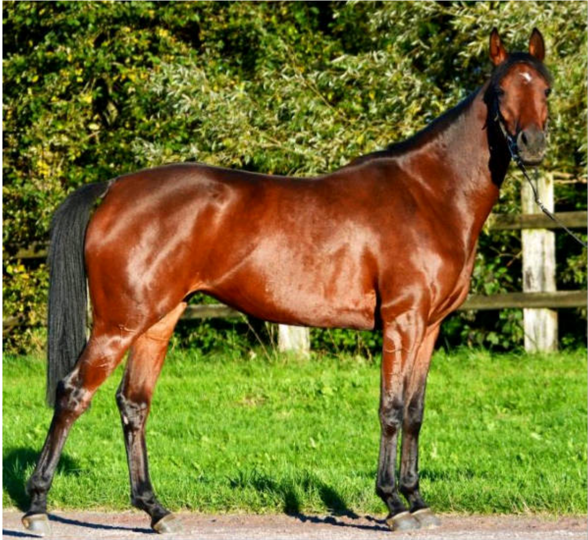
3-jährige Rennstute NIL KAMLA, 2011 von Dahess aus der SZAP Elitestute Kahloucha

Aus der tunesischen K-Linie lief die 3-jährige Stute NIL KAMLA (Dahess x Kahloucha) im 2014 ihre beiden ersten beiden Rennen. Mit ihren 2 Platzierungen bestand auch sie die SZAP Rennleistungsprüfung. Mit NIL KAMLA haben bisher insgesamt 14 Pferde aus unserer Zucht die Renn- oder Endurance- Bedingungen für die SZAP Leistungsprüfung erfüllt.