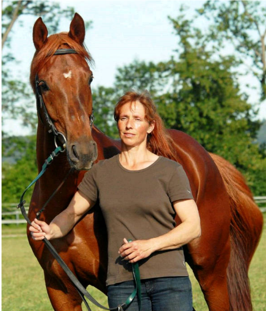
Endurance Hoffnung in Frankreich - NIL KARAZI, 2007(Dormane x Kahloucha)

Der 7-jährige Hengst NIL KARAZI (Dormane x Kahloucha), Vollbruder zu KAHRMA , wurde 2013 nach seiner Rennkarriere als zukünftiges Endurance Pferd nach Frankreich exportiert. 2011 noch Champion Rennpferd der Schweiz, konnte er in Frankreich im Endurance Sport gleich Fuss fassen. Zwischen September 2013 und August 2014 lief der noch junge Hengst 6 Mal in der Endurance, erzielte dabei 3 Siege und 2 zweite Plätze. Einmal lief er siegreich über 90 km und war einmal über diese Distanz Zweiter.