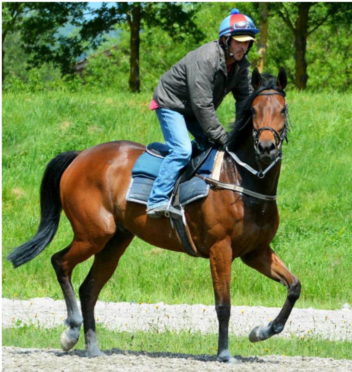
5-jähriger Wallach RIVER – der Steher