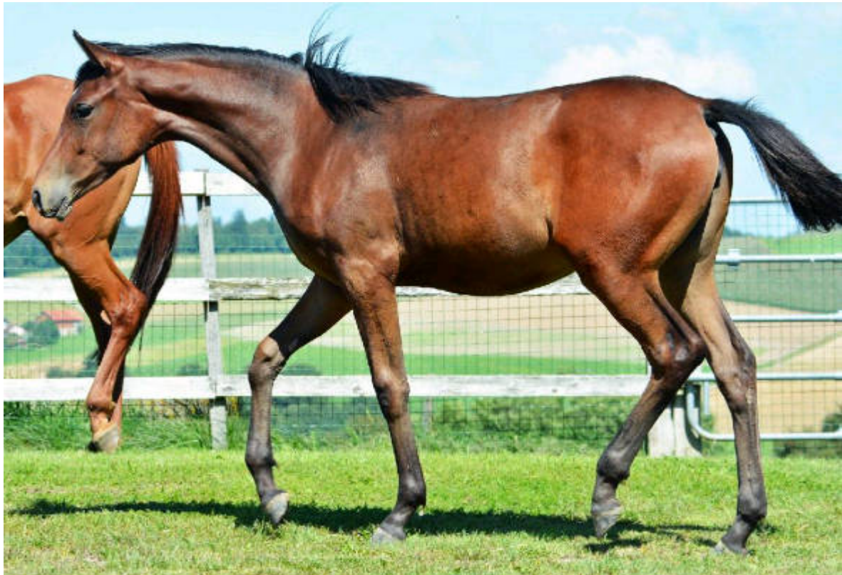
2014 Absatzstutfohlen REEM ALFALA nach Abu Dhabi exportiert

Wir hoffen, dass REEM ALFALA eine erfolgreiche Karriere im Sport und oder in der Zucht haben wird.