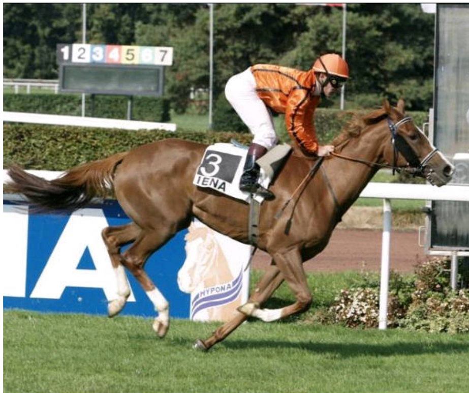
Endurance Stute KAHRMA, 2005 (Dormane x Kahloucha)

Als 3- und 4-jährige Stute verbrachte KAHRMA zwei Jahre im Trainingsquartier von Franziska Aeschbacher in Avenches. Insgesamt lief sie in dieser Zeit 9 internationale Flachrennen und war 7 Mal im Geld platziert. 2008 war sie Champion Rennpferd der Schweiz und absolvierte im gleichen Jahr wie auch 2009 zweimal die SZAP Leistungsprüfung Rennen.