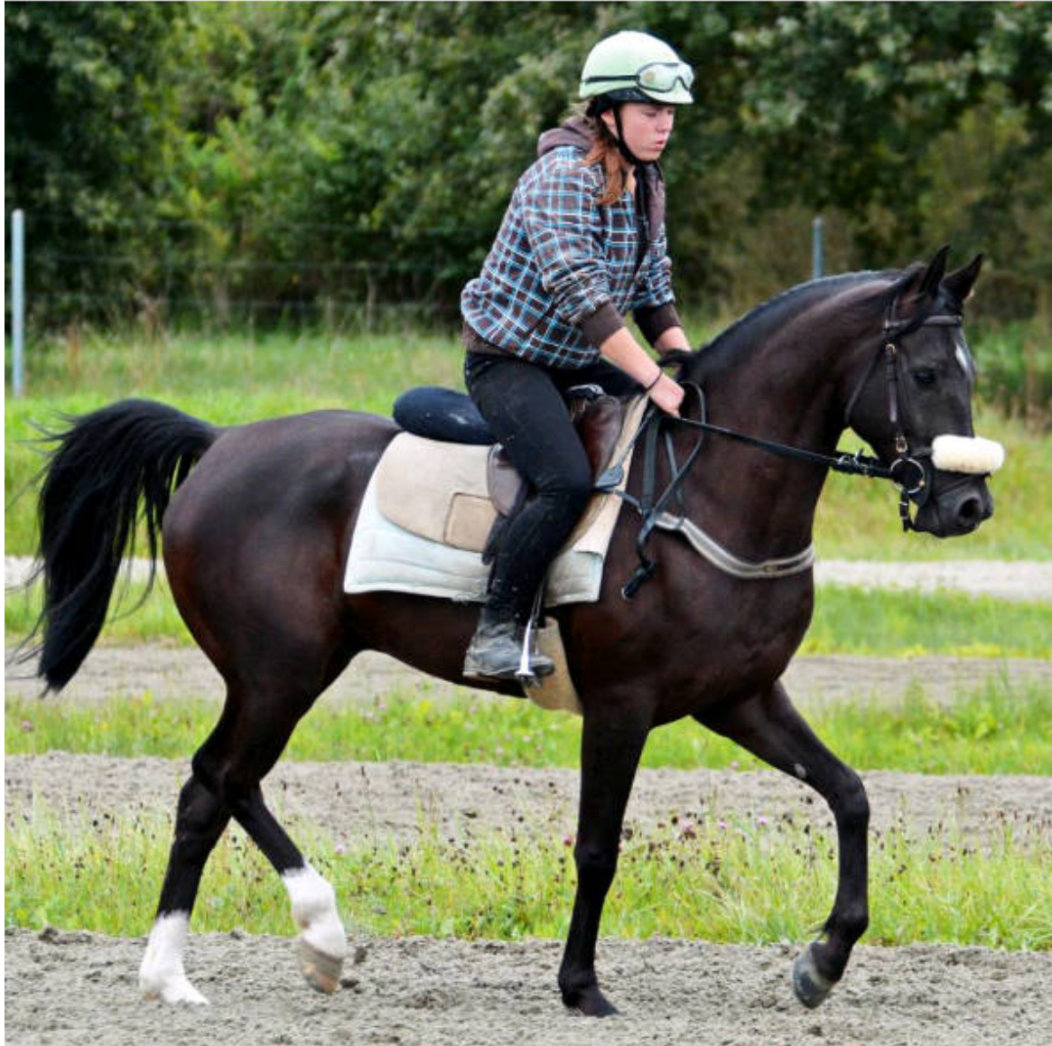
BC NIHAL , 2009 (Nil Bedouin x Nil Nura)