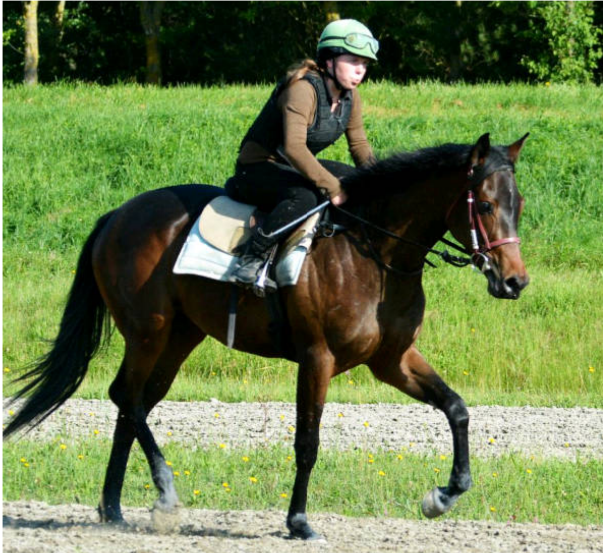
2-jährige Vollblutstute MISS SPIRIT, 2012 (Spirit One x Miss Lloyds)

Unter den Farben von Urs Aeschbacher gab die 2-jährige MISS SPIRIT (Spirit One x Miss Lloyds) im Herbst mit einem 6. Platz ihr Lebensdebüt. Zum Saisonabschluss am 1. November erzielte sie bei ihrem zweiten Start als beste Stute den guten zweiten Platz.