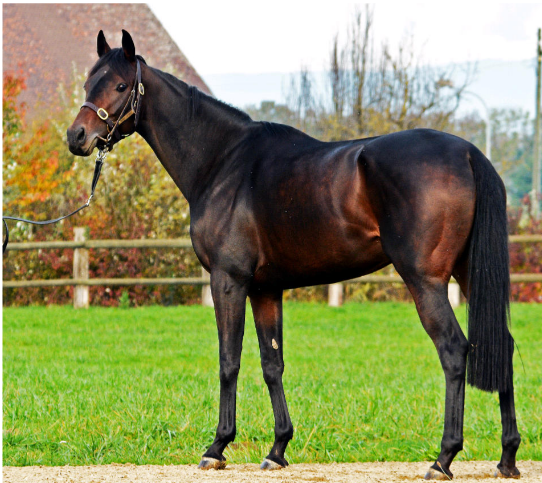
MISS SPIRIT (Spirit One x Miss Lloyds), beste 3-jährige Englisch Vollblutstute der Schweiz mit jeweils einem dritten Platz in den klassischen Zuchtrennen für Stuten, den 1000 Guineas und dem Prix de Diane, dem Stutenderby.