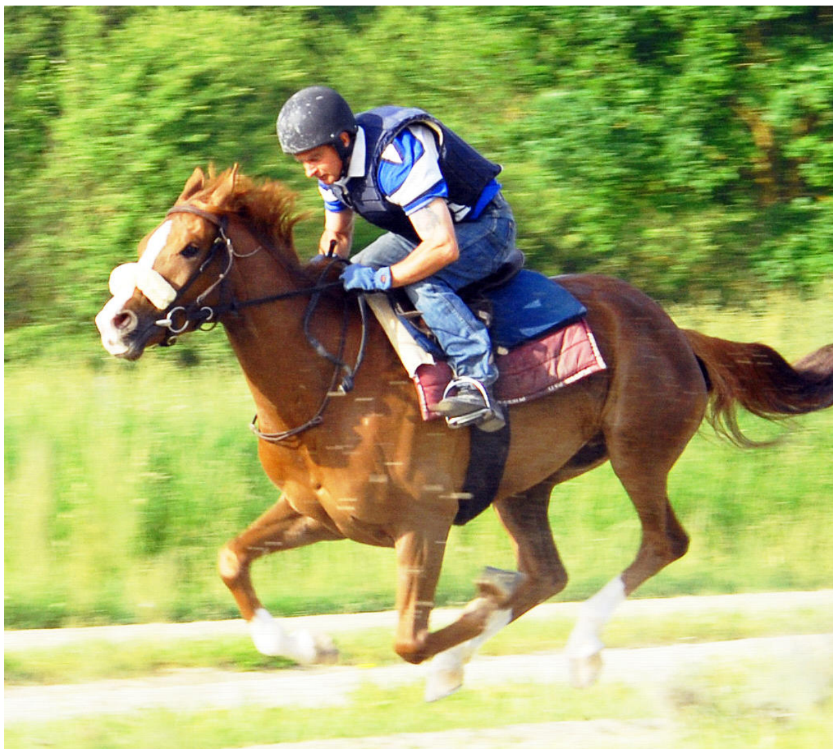
Endurance Stute KAHRMA , 2005 (Dormane x Kahloucha – SZAP Elitestute) aus der K-Linie, hier im Jahr 2008 als 3-jährige im Rennttraining bei Franziska Aeschbacher in Avenches