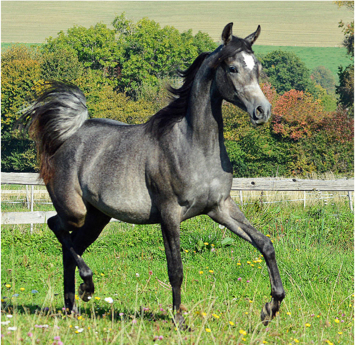
NIL NEMANDA , 2014, (Emerald J x Nil Nana). In der 5. Generation der N-Linie verkörpert die NIL NANA Tochter den klassischen Nile Typ und zeichnet sich vor allem durch ihre Eleganz und Hochbeinigkeit in einem quadratischen Rahmen aus.