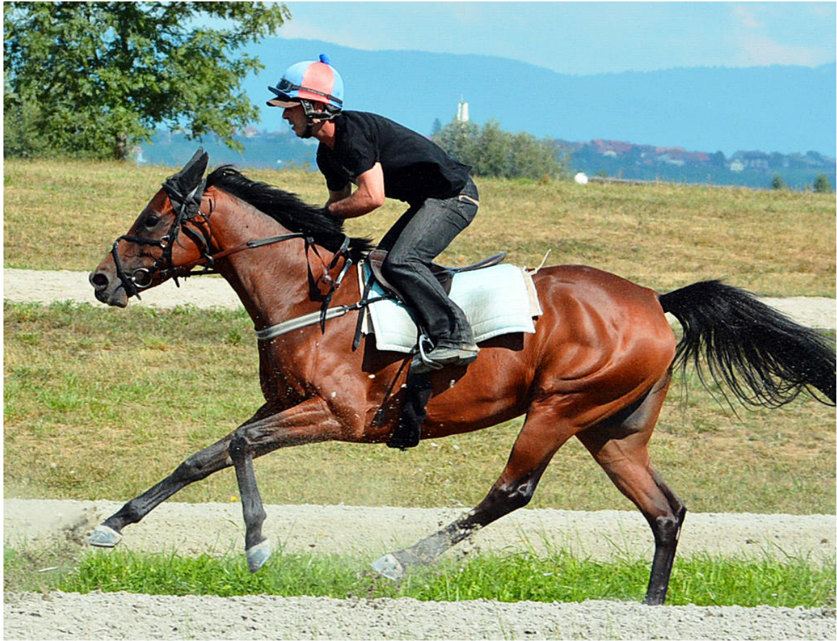
NIL KAMLA , 2011 (Dahess x Kahloucha – SZAP Elitestute)

dritten sowie 4 weiteren Platzierungen, wovon einmal auf Listenebene in St. Moritz, war die Stute bis auf ein Rennen immer im Geld platziert. Die DAHESS Tochter überzeugte mit ihrer Konstanz, ihrer Härte und ihrem Leistungswillen.