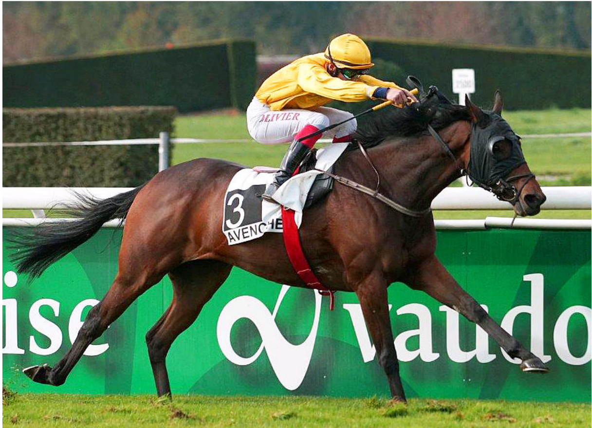
RIVER , 2009 (Della Francesca x River Sans Retour) bei seinem Sieg im letzten Rennen der Saison in Avenches, geritten von Champion Jockey Olivier Plaçais in den Besitzerfarben von Stall Golden Arabians.