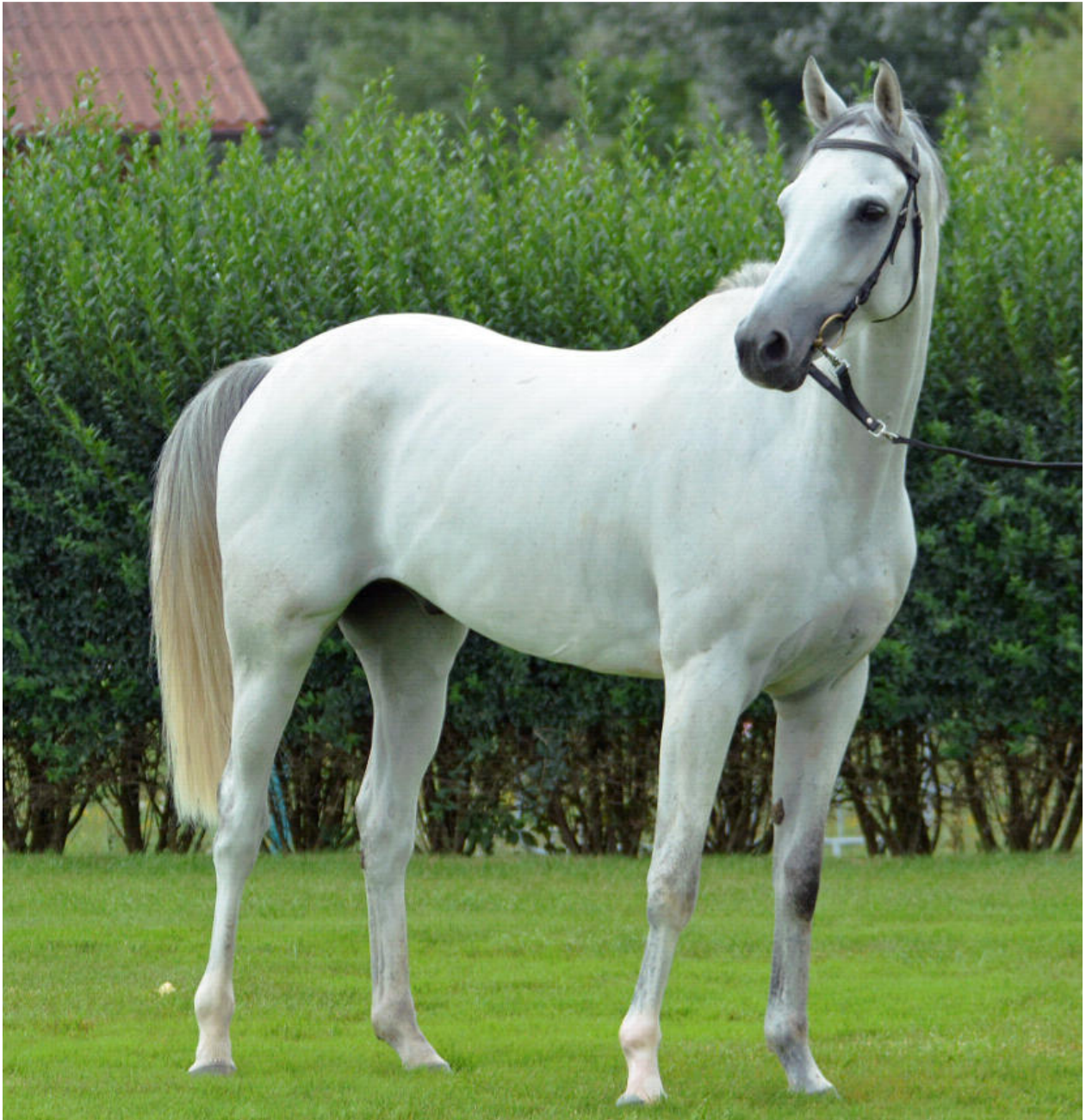
NIL ASHAL, 2008 (Nil Bedouin x Nil Abiat) – erfolgreichstes Rennpferd aus Schweizer Zucht