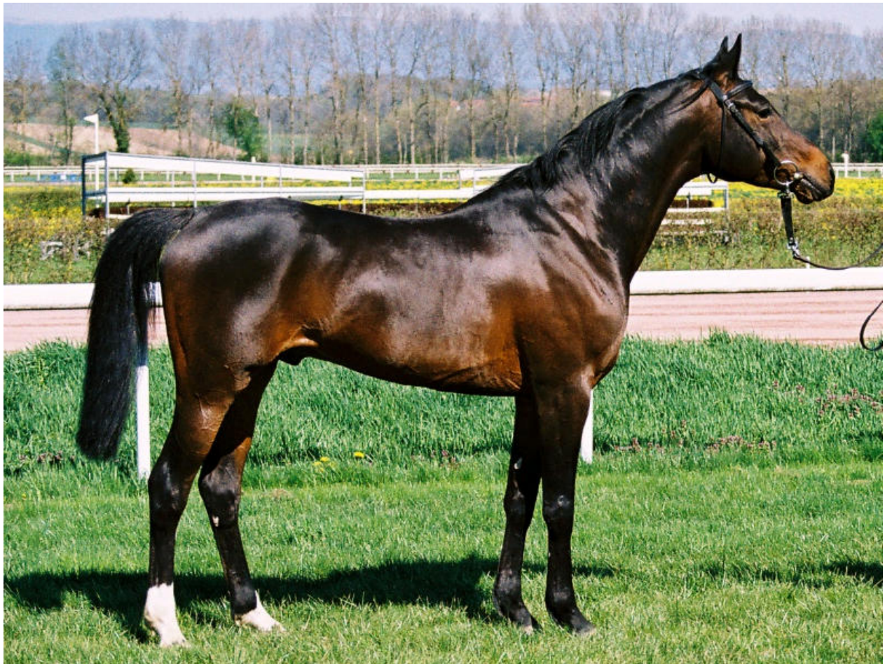
NIL BEDOUIN , 1999 (Barour de Cardonne x Nil Tahani v. Versal) als 5-jähriger während seiner Rennkarriere in voller Rennkondition auf der Rennbahn in Avenches.