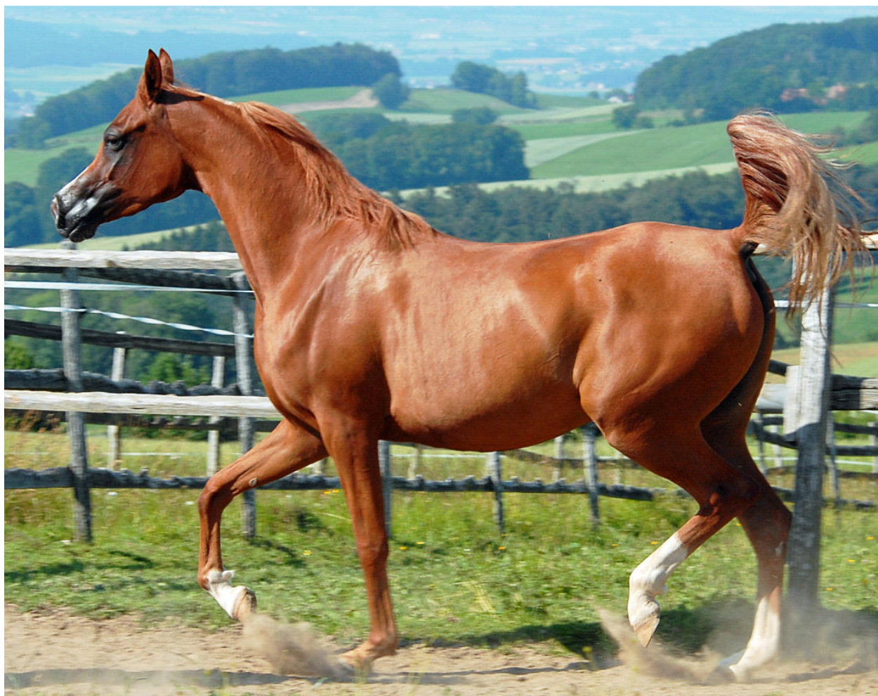
NIL NIKINIKEE , 2009 – 2015 (QR Marc x Nil Nana v. Extreme). Vertreterin der N-Linie in der 5. Generation; blickt nach ihrem kurzen Leben von 6 Jahren auf eine bemerkenswerte Schau- und Zuchtkarriere.