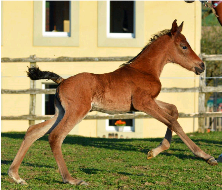
AMAIRAH , 2915 (Nil Bedouin x Galina v. Gusar)

Stutfohlen im alten russischen Leistungstyp mit überdurchschnittlicher Bewegung.