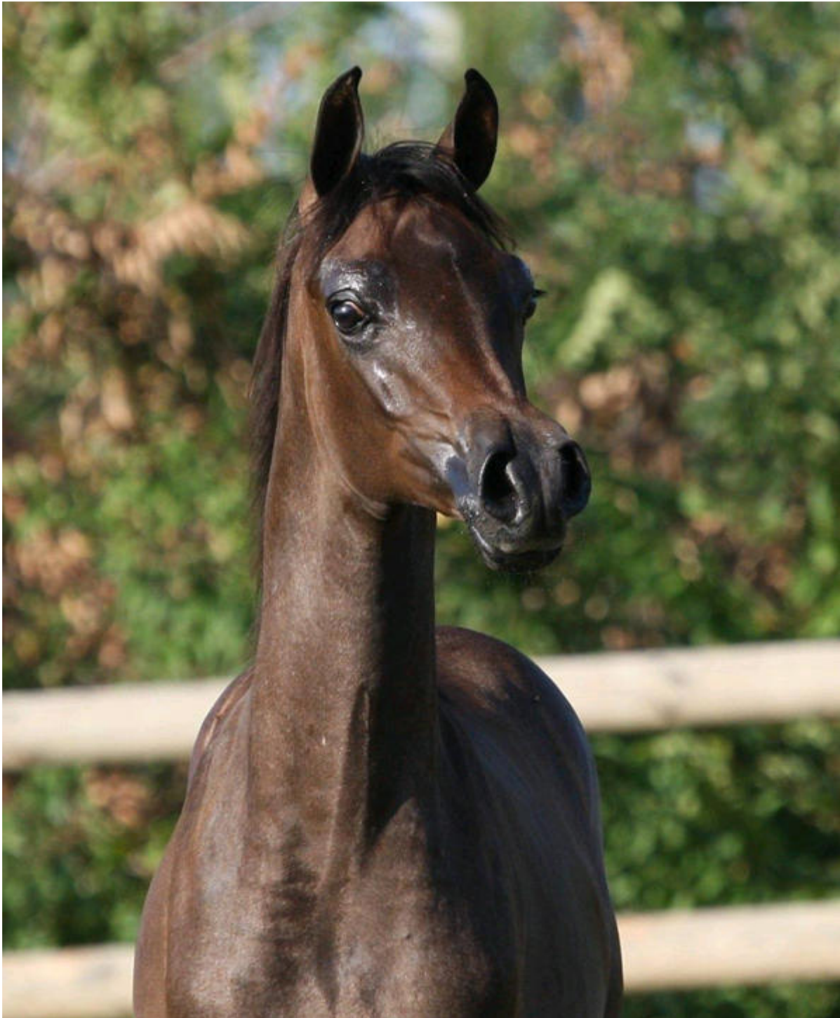
NABORR BP , 2015 (EKS Alihandro x Nil Nouza v. Gips), Champion Hengstfohlen 2015. Erstklassiges Hengstfohlen mit ausgezeichnetem Typ und viel Ausstrahlung, repräsentiert die 4. Generation der N-Linie von Nile Arabians.