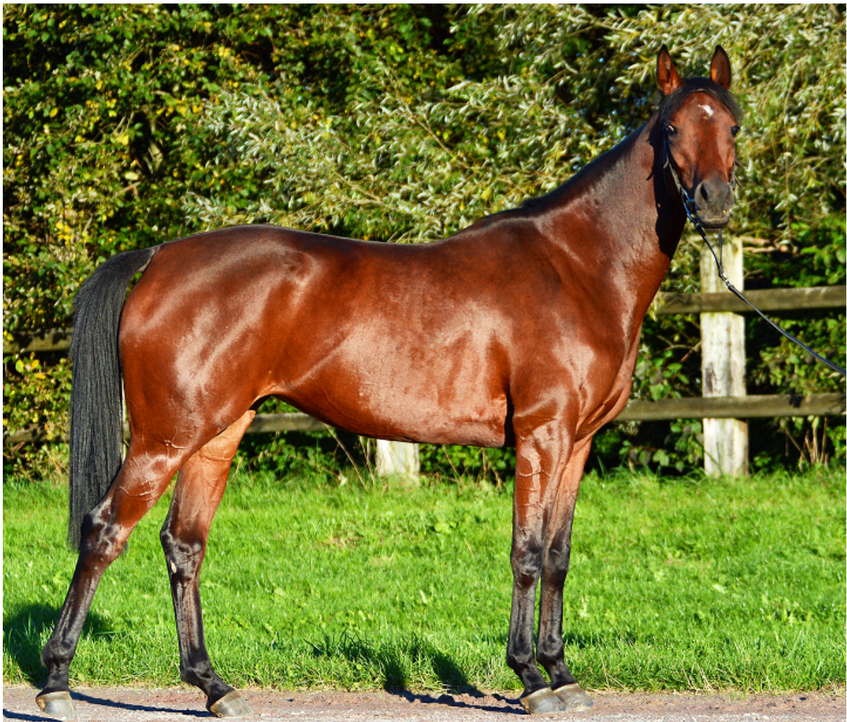
Nil Kamla, Listensiegerin und Mutter von Kiss du Nil, hier als 3-jährige im Renntraining, Foto Nile Arabians