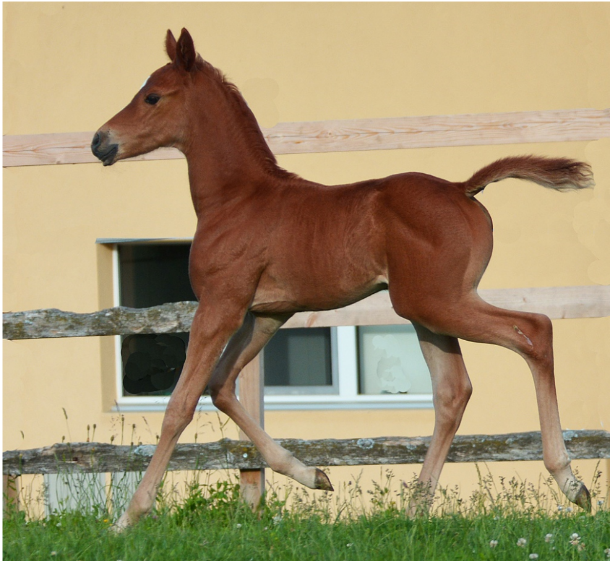
Kiss du Nil im Alter von 2 Wochen.

bleibt zu hoffen, dass Assy diese beiden Merkmale auch vererben wird. Dieses überdurchschnittliche Leistungsvermögen liegt bei Assy in der Familie. Er ist ein Vollbruder im Blut der Hengste EBRAZ , MUAZZAZ und MARED AL SAHRA , alles Gruppe PA1 Sieger und alles Amer Söhne aus der Massamarie , einer Vollschwester von Margouia , der Mutter von Assy . Während MUAZZAZ und MARED AL SAHRA bereits als erfolgreiche Deckhengste im Einsatz stehen, befindet sich EBRAZ immer noch im Renntraining. In der Rennsaison 2017 war er das weltweit erfolgreichste Rennpferd mit einer Jahresgewinnsumme von € 775,000.