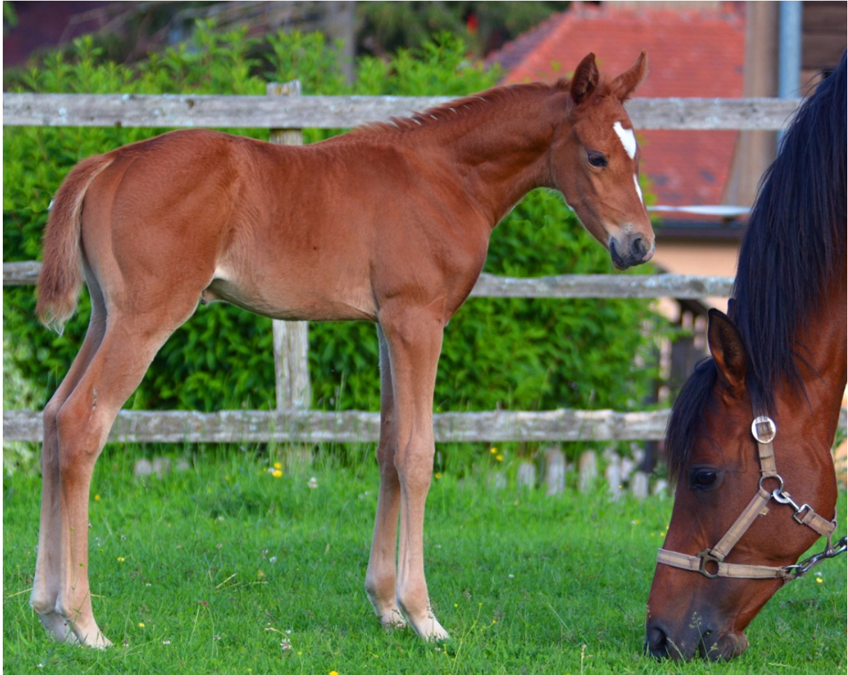
Kiss du Nil aus der Nil Kamla von Assy, ein harmonisches und kräftig gebautes Stutfohlen.

Die erfolgreiche Listensiegerin von St. Moritz, Nil Kamla, brachte am 20. Mai ein gesundes Stutfohlen zur Welt. Vater von Kiss du Nil ist der in Qatar geborene Amer Sohn Assy, ein interessanter Hengst, der dieses Jahr auf seinen ersten Fohlenjahrgang blickt.