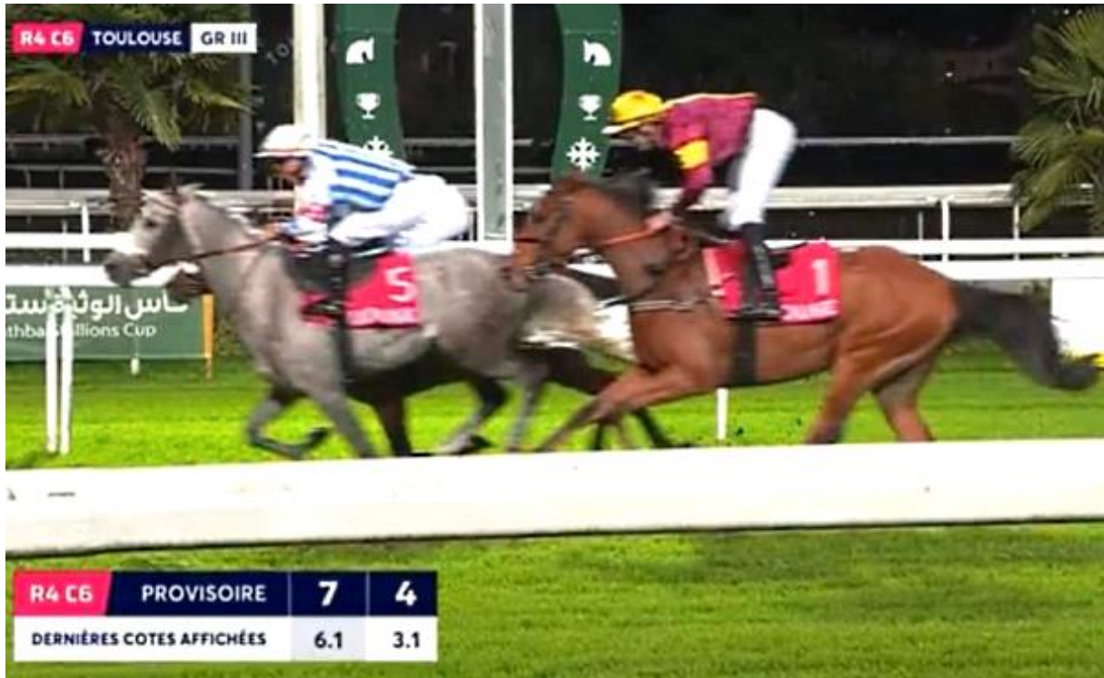
Bild: Einlauf im Prix Cheri Bibi (GR.3 PA) in Toulouse. KHAN DU NIL mit Stéphane Laurent hinter den dritt- und viertplatzierten Pferden

Sein Reiter Stéphane Laurent positionierte ihn nach dem Start an die zweite Stelle. Dort blieb er entlang der Gegengerade bis in den letzten Bogen hinein. Im Bogen brauchte er aussen herum etwas viel Weg und verlor im tiefen Bogen an Schwung, was ihn eingangs Zielgerade auf die hinterste Position zurücksetzte. Sehr couragiert kämpfte er sich auf den letzten 400 Metern zurück und sicherte sich noch den fünften Platz nur gerade eine halbe Länge und einen kurzen Kopf hinter dem viert- und drittplatzierten Pferd.