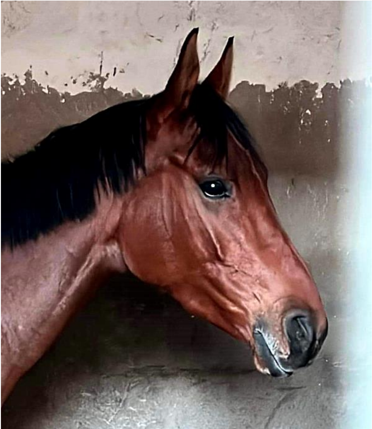
Bild: KAMUN DU NIL kurz vor dem Rennen in seiner Boxe in Toulouse